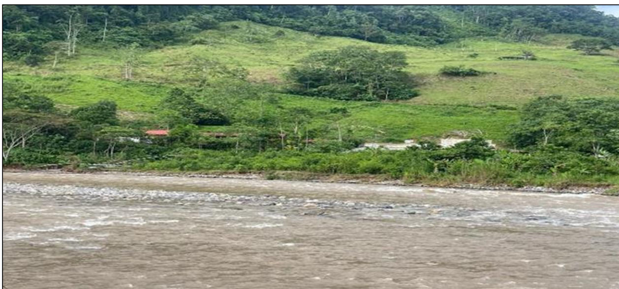
FIGURA N° 01: SE EVIDENCIA INCREMENTO DE CAUCE EN EL RÍO POZUZO, PONIENDO EN RIESGO VIVIENDAS Y VIA (TROCHA CARROZABLE).