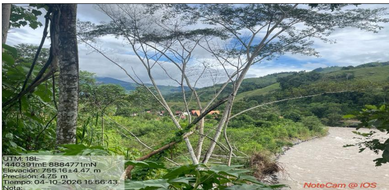
FIGURA N° 04: SE APRECIA EL NIVEL RIO CON LA MARGEN DERECHA QUE REQUIERE DE PROTECCION CON MURO DE GAVIONES