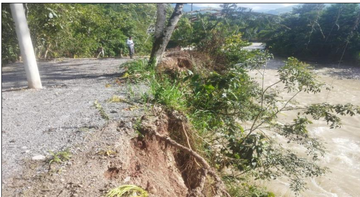
FIGURA N° 02: SOCAVACION Y EROSION DEL RÍO POZUZO, AFECTANDO PLATAFORMA DE TROCHA CARROZABLE.