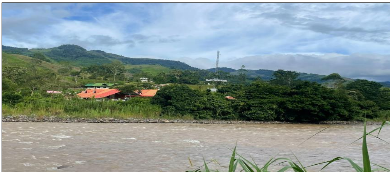
FIGURA N° 03: SE OBSERVA EROSION DEL RIO POZUZO Y COLMATACION CON MATERIAL DE ARRASTRE, OBSTRUYENDO EL LIBRE CAUCE.